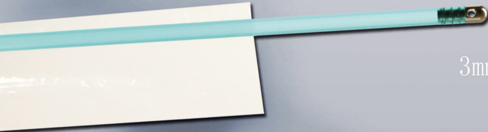
3mm胚胎移植外套和软外套