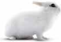
..... 兔 .....