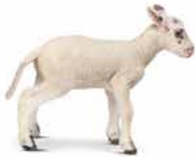
..... 绵羊 .....