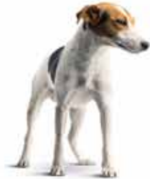
..... 狗 .....