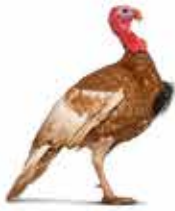
..... 火鸡 .....